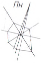
Схема благоустрою території зелених насаджень по вул Костянтинівській в районі садиби №229